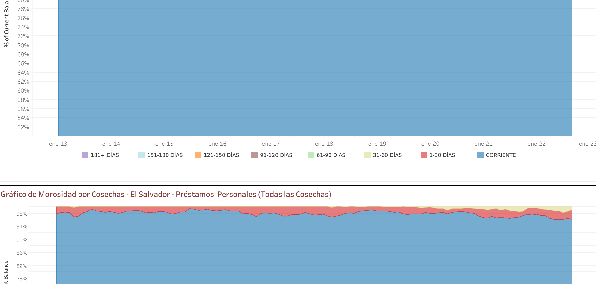
Gráfico de Morosidad por Cosechas - El Salvador - Préstamos Personales (Todas las Cosechas)